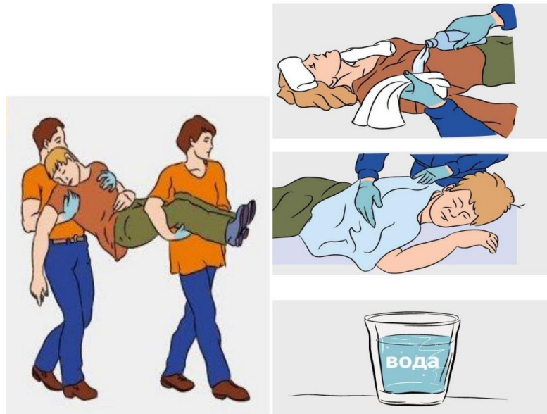
Рисунок 1 – Оказание первой помощи пострадавшему при тепловом ударе

10. Пользуясь рис.1, составьте алгоритм ваших действий по оказанию помощи пострадавшему при тепловом (солнечном) ударе: